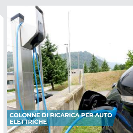
COLONNE DI RICARICA PER AUTO ELETTRICHE